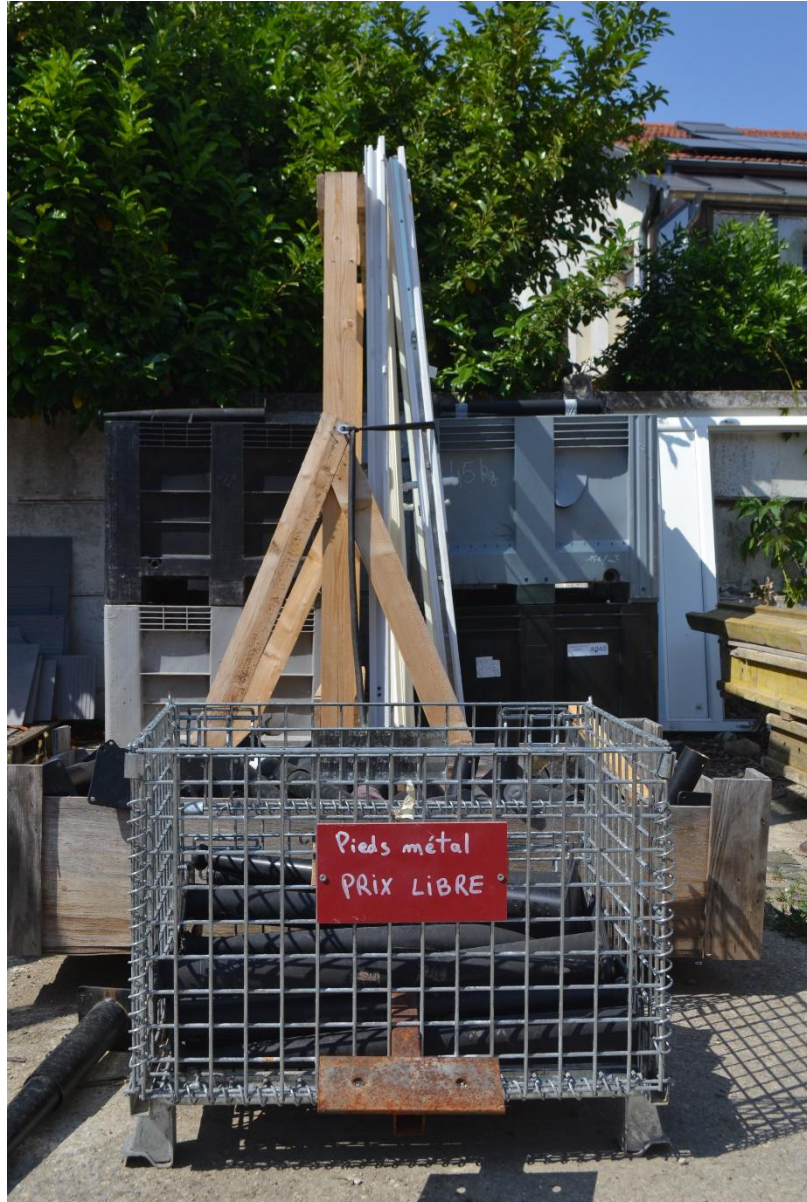
7. Parfois, les clients définissent la valeur économique de l'objet ou du matériau (Dillenseger, 2023)