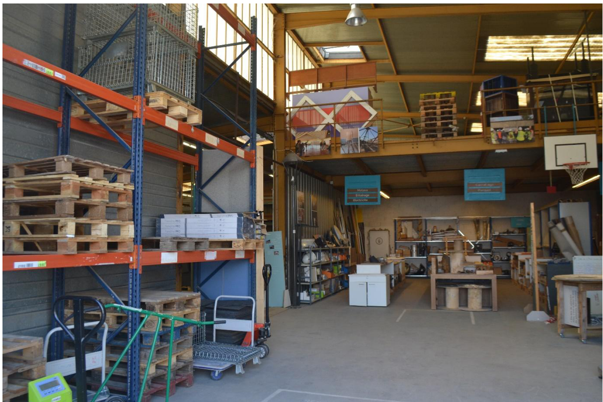
Couverture : L'entrée du Minéstock à Villeurbanne