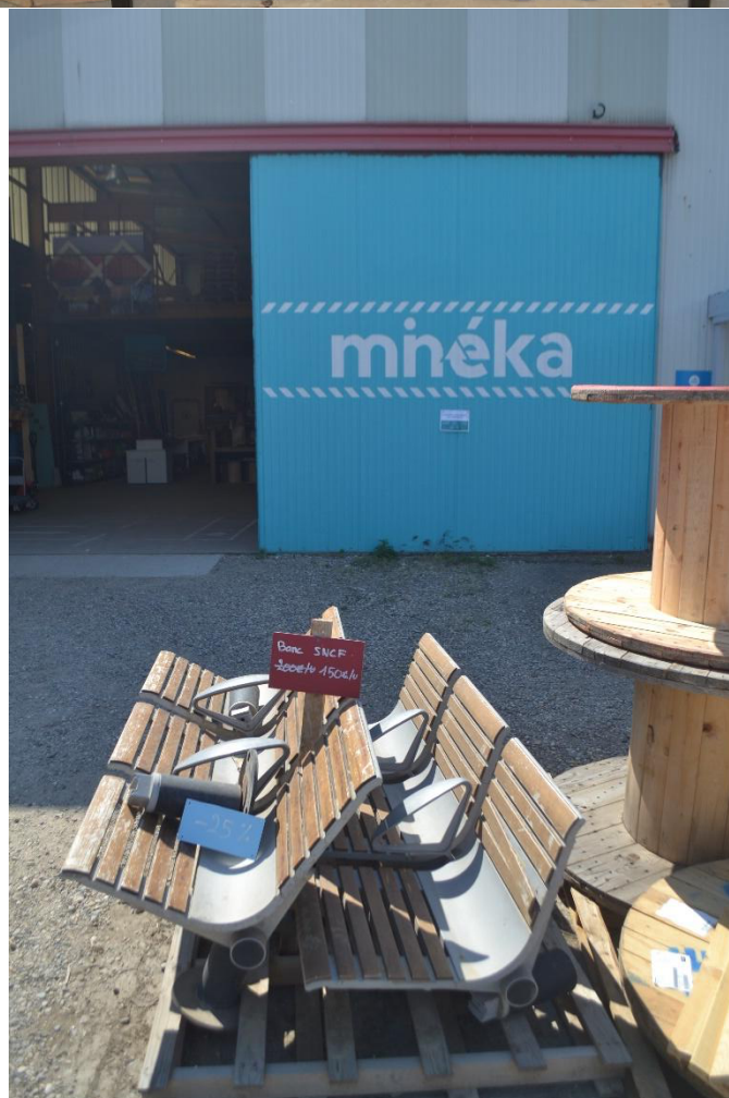
4 et 5. D'autres objets sont plus originaux comme cette armoire issue d'une exposition temporaire (Dillenseger, 2023) ou ces bancs SNCF (Dillenseger, 2023)