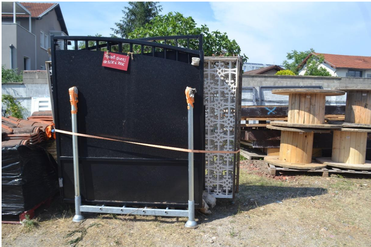
2 et 3. Les objets récupérés sont de toute taille : des prises électriques et des interrupteurs (Dillenseger, 2023) ou des portails et des tourets (Dillenseger, 2023)