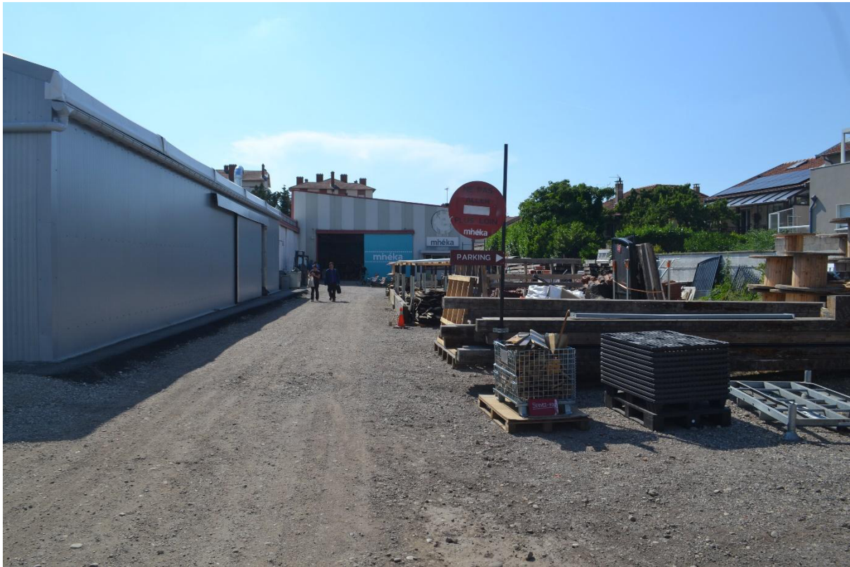
6. Le minéstock, siège de l'association Minéka et lieu de vente et de stockage (Dillenseger, 2023)